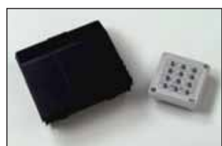
CODY LIGHT QUADRA